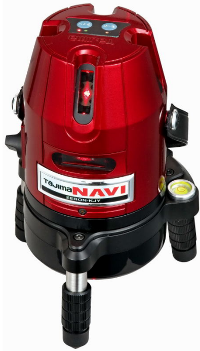
NAVIゼロKJY本器と受光器(右)